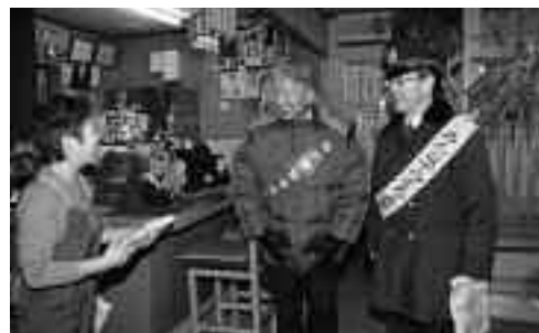
▲ 12月21日、歳末防犯パトロール