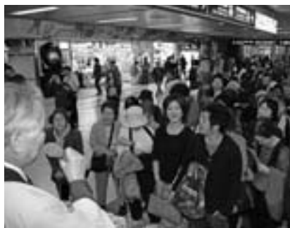
長蛇の列ができました