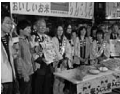
どさんこワイド179の撮影風景