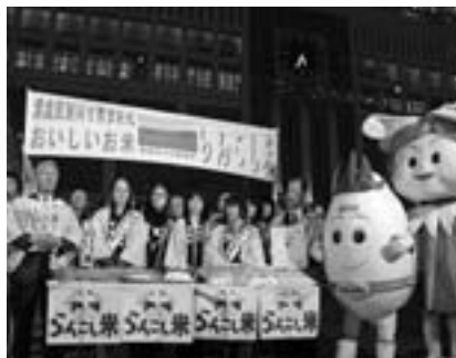
テレビの出演時間が間近に迫り、少し緊張気味です