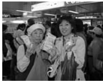
「らんこし米食べていますよ」との温かい言葉も