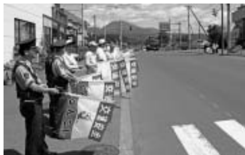
▲8月12日、黄色い旗の波

7月11日、国道上を走行していた車両が、スピードを出しながらぼんやり運転をしていたため、カーブを曲がりきれず路外に飛び出す事故が発生しました。