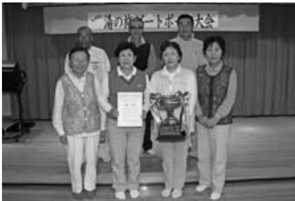
優勝した、こぶしチームの皆さん

7月22日、第9回蘭越町営温泉湯の旅ゲートボール大会が、総合運動公園ゲートボール場を会場に、町内から6チーム49人の選手が参加し、開催されました。競技は、2組に分かれて予選リーグ戦を行い、その後、1位同士による決勝戦と2位同士による3位決定戦が行われ、青空の下、選手たちは、日頃の練習の成果を発揮し、熱戦を繰り広げました。