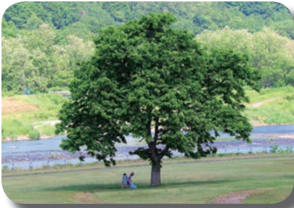
△ 6/14 大きな栗の木の下で

一丁を余す暮らしの冷奴 中兼裕美子 坂行けばあかしやの花にほひくる 上野 朝子 深みどり水面に映える水彩画 西岡 孝一 したたかに生きて夏越の輪をめぐれ 田中 水月 ♪師（故・石坂壽一氏）を偲んで♪ 石坂 寿鳳 星屑のひとつは父の鳥賊灯なり