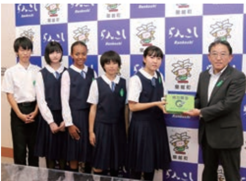
△金町長へ募金箱を手渡す蘭中生徒会の皆さん

6月21日、蘭越中学校生徒会の皆さんが来庁し、金町長へ緑の募金が届けられました。