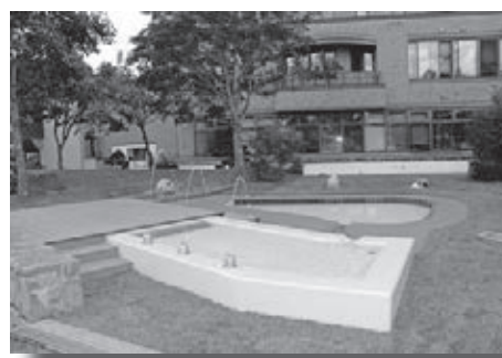
▲ ふれあい広場親水施設整備工事