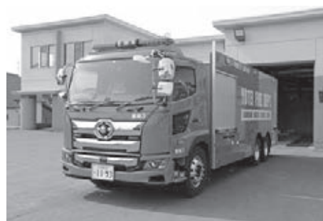
▲ 小型動力ポンプ付水槽車購入