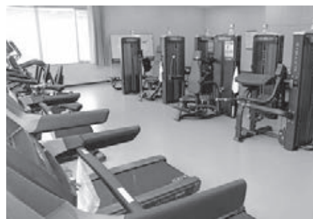
▲ 総合体育館トレーニング機器購入