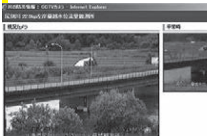
豊国橋のカメラ映像

CCTVカメラの映像で、現在の川の様子が分かり、川に近づかなくても状況を知ることができます。