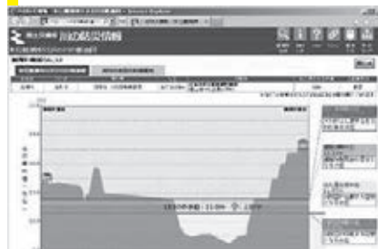
蘭越観測所等の水位

川に設置した水位計で、近くの川の水位がどのような状況になっているのかを、リアルタイムで確認することができます。