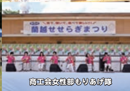
蘭越せせらぎまつり