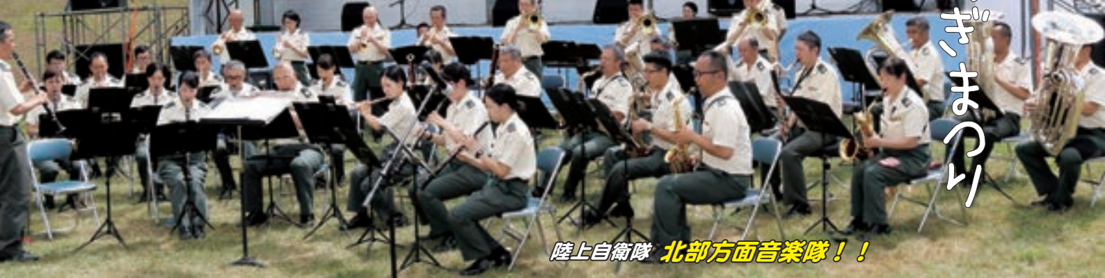
陸上自衛隊 北部方面音楽隊！！

7月29日、第5回蘭越せせらぎまつりが尻別川河畔のランラン公園で開催されました。 清流日本一に幾度も輝いた尻別川のほとりで、「夏の一日を大いに楽しもう」と企画したイベントで、今年で5回目を迎えました。 前日の前夜祭では、大連発花火が川面を彩り、当日の本祭では、これまでになく晴天と暑さの中、会場には2,000人を超える来場者が訪れました。 ステージでは、ハンバーガーボイスが大いに観客を湧かせ、蘭越恒例の餅まきでイベントのクライマックスを飾りました。