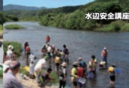
水辺安全講座~お魚いたよ~