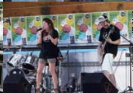
前夜祭も盛り上がり!