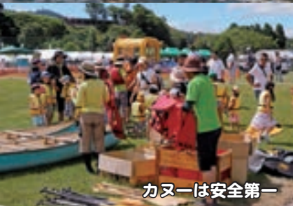
カヌーは安全第一 危険な暑さもなんのその！