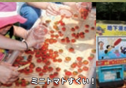
ミニトマトすくい！