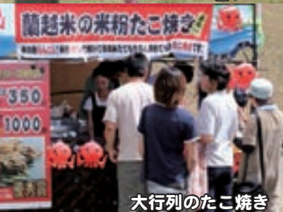
大行列のたこ焼き