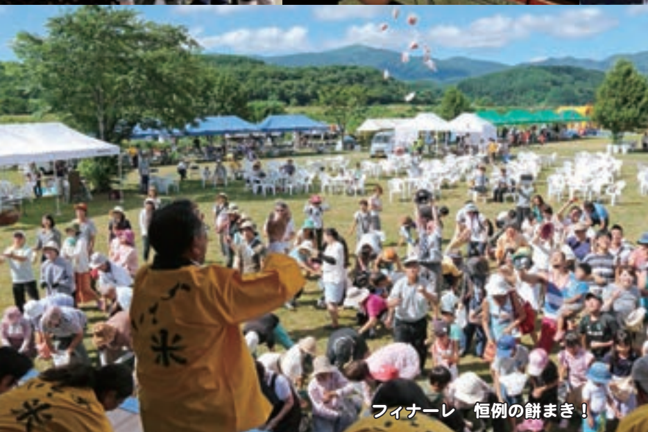
フィナーレ 恒例の餅まき!