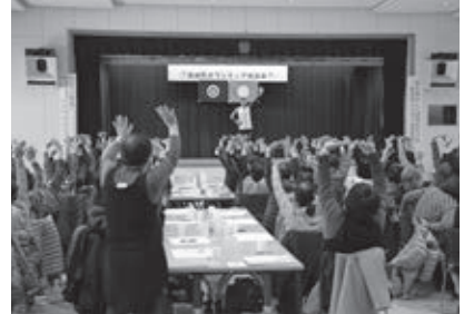
11日・第25回「港町春の文化まつり」