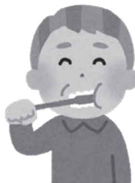
全身の健康は歯の健康から

みなさんの歯・歯肉の状態や口腔清掃状態等をチェックし、誤えん性肺炎等につながる口腔機能低下を予防するため、また、お口の健康状態を知る良い機会となりますので、1年に1回定期的に歯科健診を受診しましょう。