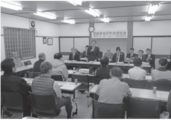
▲蘭越東地区連合町内会町政懇談会の光景

また、水上・淀川・大谷地域振興会からは、地域の有志が集まり、地域で解決しなければならぬ課題