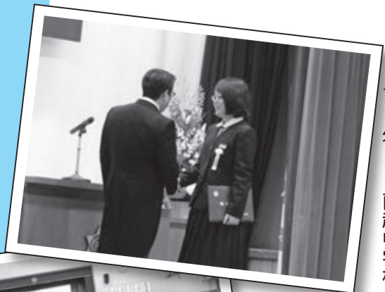
◀ 3月15日 蘭越中学校

4月からスタートした新たな生活においても、さらにたくましく、一歩ずつしっかりと前進していくことを願います。