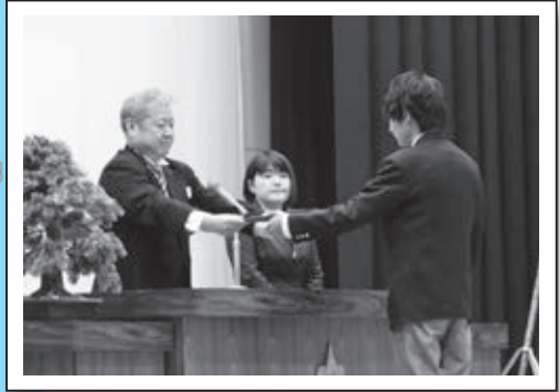
◀ 3月1日 蘭越高等学校

町内の各学校などで卒業式・卒業式が行われ、それぞれの思いを胸に、楽しく過ごした学び舎を巣立ちました。